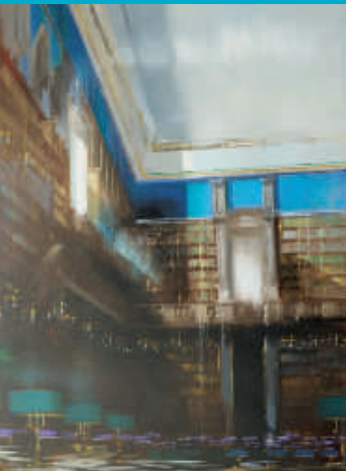
Études viennoises II - 116 x 89 cm