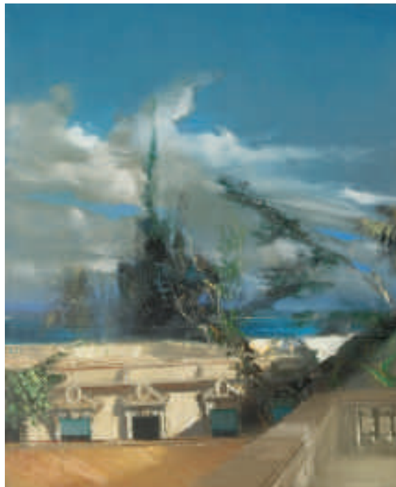
Été sicilien - 100 x 81 cm