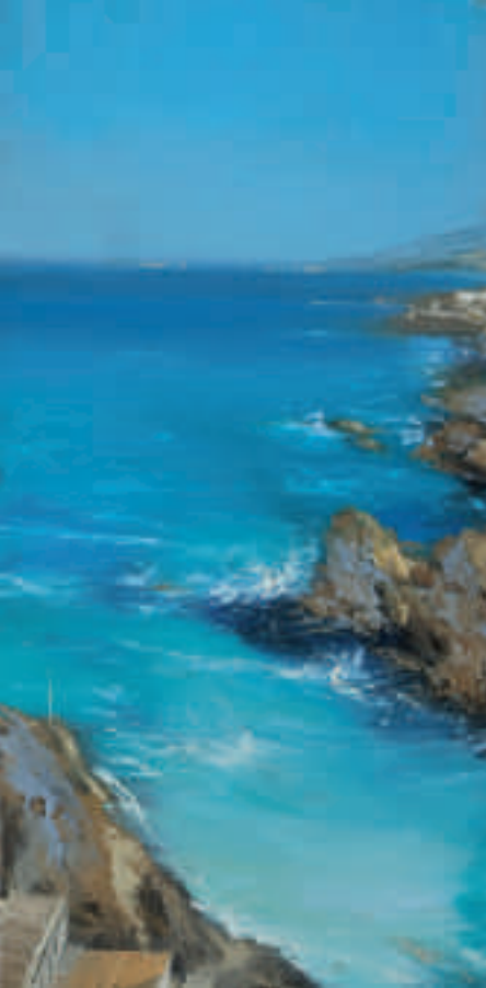
Hiver sarde - 100 x 50 cm

Né à Paris, en 1962 est un peintre franco-suisse. Diplômé en histoire de l'art à la Sorbonne, il expose depuis 1988 dans plusieurs galeries parisiennes, de Suisse et des États-Unis. Présenté à la FIAC en 1993 et en 1995, il participe au mécénat Ebel Art et culture en Suisse de 1990 à 1995 à Bâle et expose en 1989, 1991 et 1999 des portraits à l'Institut de France. Ayant reçu de multiples commandes de la part d'entreprises, comme les montres Ebel (1990), le Champagne Dom Ruinart (1992), Natexis Banques Populaires (1999 et 2000) ou Tiffany & Co. (2012, 2013), il a également peint le décor du Bourgeois Gentilhomme pour le Théâtre de Neuilly-sur-Seine en 1993.