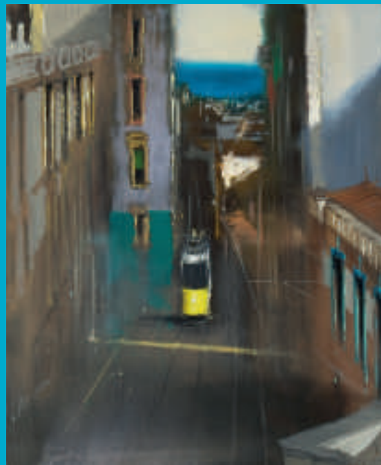
Tramway à Lisbonne IV - 65 x 54 cm