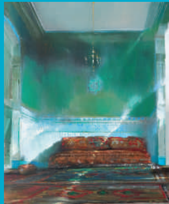
Salon arabe - 100 x 81 cm

En couverture : Effet cubain - 130 x 89 cm